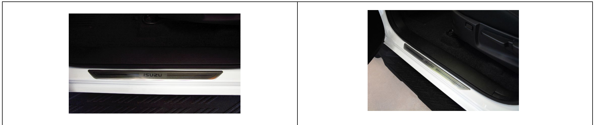
Kit De Protection De Seuil De Porte De Marque Isuzu