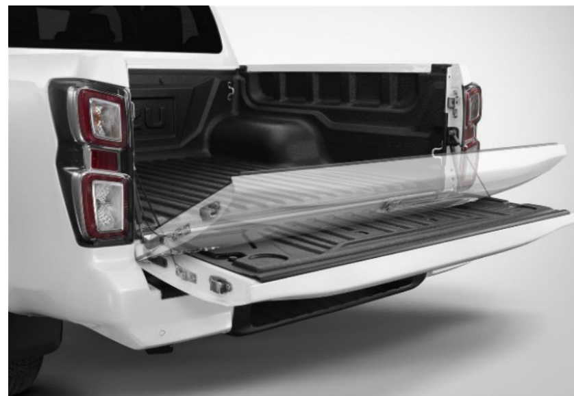
Aide à l'ouverture/fermeture du hayon