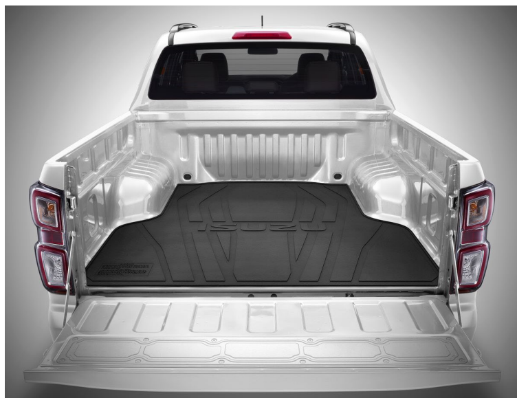
TAPIS POUR FOND DE BENNE